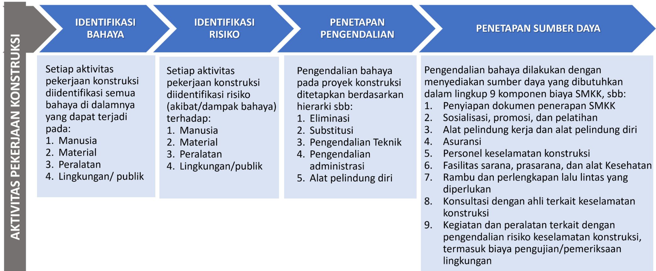
Gambar I.1 Alur Penyusunan Biaya SMKK